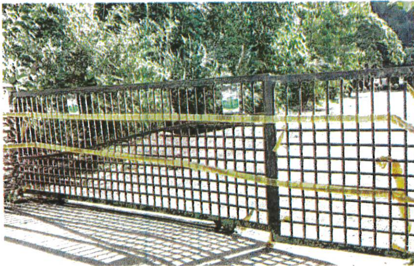
NOTIS penutupan dan tali rentang yang diletakkan di pintu masuk berikutan dua kes kencing tikus di Taman Eko Rimba Lata Bayu, Baling.