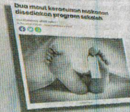
Laporan Sinar Harian berkaitan kejadian dua mangsa maut akibat keracunan makanan di Gombak.

Jabatan Kesihatan Negeri Selangor (JKNS) juga sedang menjalankan siasatan bagi mengesan kes baharu berhubung kejadian itu.