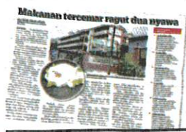
KERATAN Kosmo! 13 Jun 2024.

GOMBAK – Polis mengambil keterangan 15 individu termasuk pengusaha katering bagi membantu siasatan berhubung kes keracunan makanan hingga menyebabkan kematian seorang kanak-kanak perempuan berusia setahun tujuh bulan dan remaja lelaki berusia 17 tahun pada 10 Jun lalu.